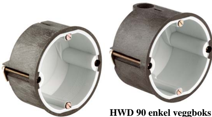
HWD 90 enkel veggboxs - dyp

Dersom en brann skulle oppstå , vil det integrerte brannhemmende middelet umiddelbart reagere. Materialet vil svulle og fungere som en sikker tetning av installasjonsåpningen i brannveggen. Selv om det skulle være installert en tilsvarende boks på motsatt side av veggen, og uten noen form for ekstra forsterkninger i veggen, vil B90-veggen opprettholde sine strukturelle egenskaper.